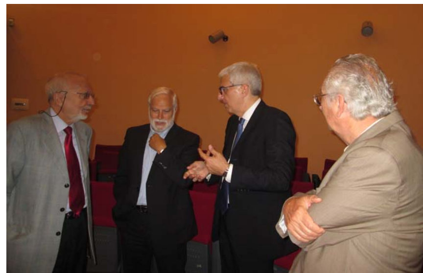
Pubblicazioni dell'Accademia Gioenia di Catania